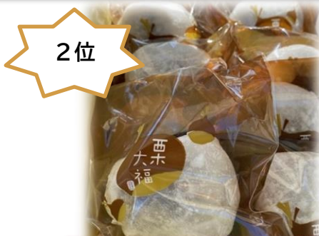
一粒栗大福(虎溪製菓舗)