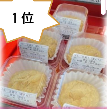
栗もち(虎溪製菓舗)