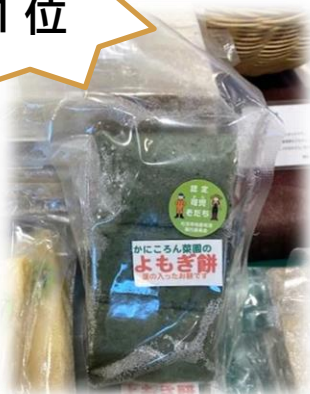
よもぎ餅(かにころん菜園)