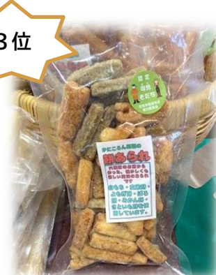
餅あられ(かにころん菜園)